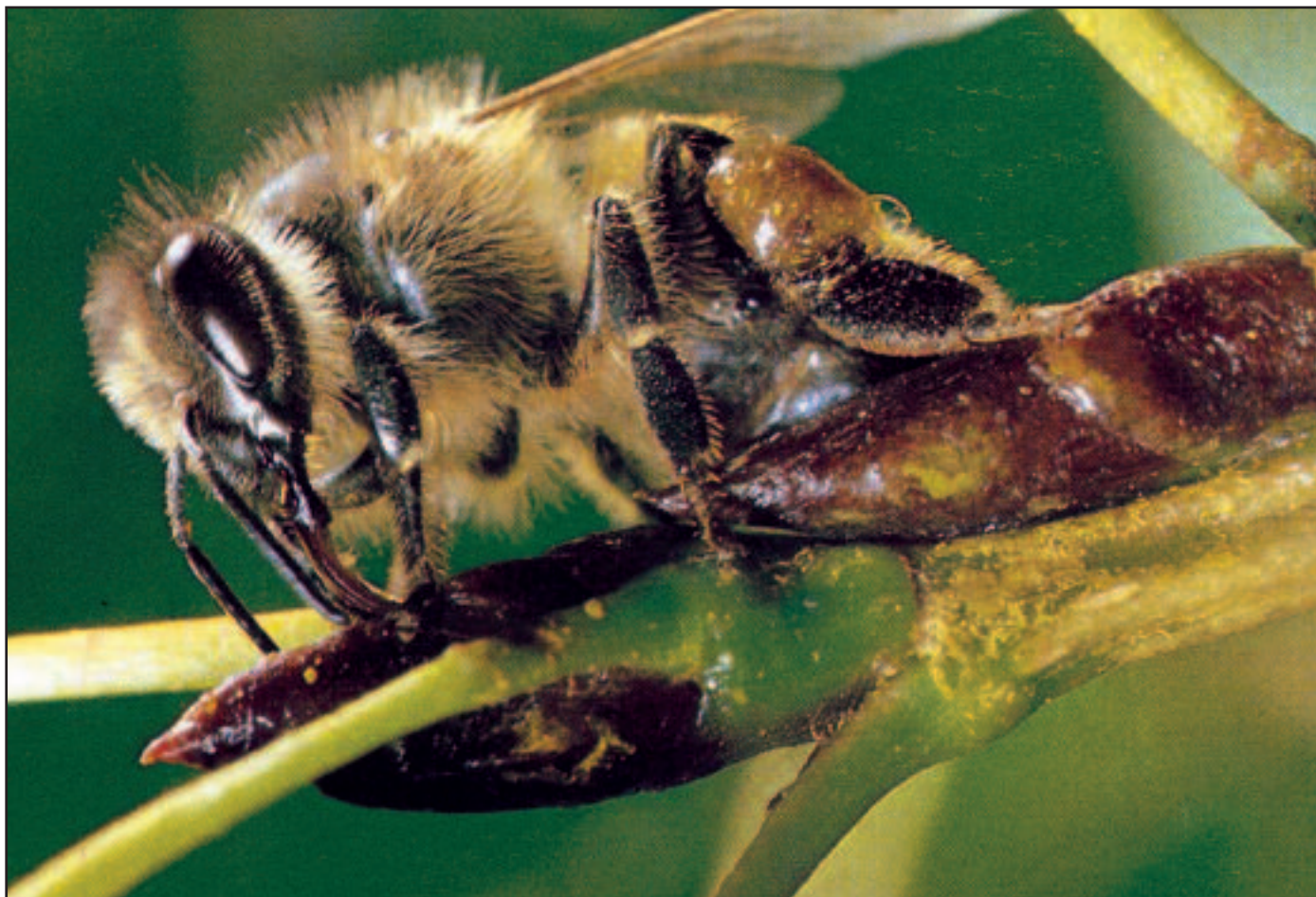
El sentido del gusto.

N uestras abejas están provistas de sistemas sensoriales que les permiten analizar su entorno vital. A veces resulta un tanto difícil comprender como funcionan dichos sistemas ya que en muchos casos nosotros establecemos comparaciones con nuestros propios órganos de los sentidos. Por ejemplo, los ojos de las abejas son desde un punto de vista estructural bastante diferentes a los nuestros, pero las dos especies (humanos y abejas) los utilizamos para un mismo fin: conocer mediante imágenes el mundo que nos rodea. En el caso de las antenas la cosa se complica algo ya que nosotros carecemos de órganos de este tipo, y por este motivo a veces resulta algo complicado conocer para que utilizan las abejas sus antenas o que sentidos radican en