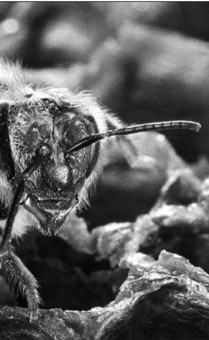
Un grupo de sensilas que se han propuesto como receptores de temperatura y humedad.