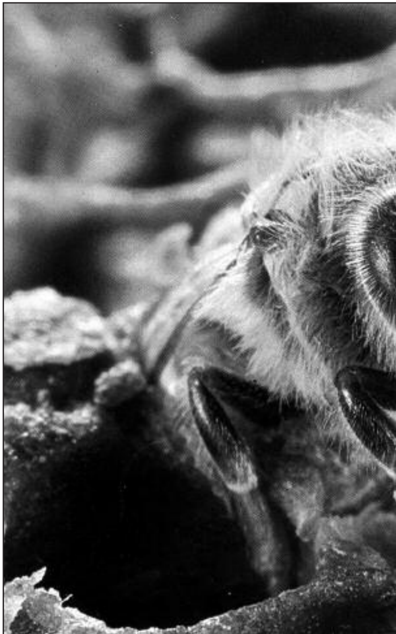
En el borde distal de los últimos ocho anillos del flagelo las abejas cuentan con un peque-

Vamos a volver brevemente a la morfología, es decir, el estudio de la forma. Desde este punto de vista los órganos receptores de la superfi-