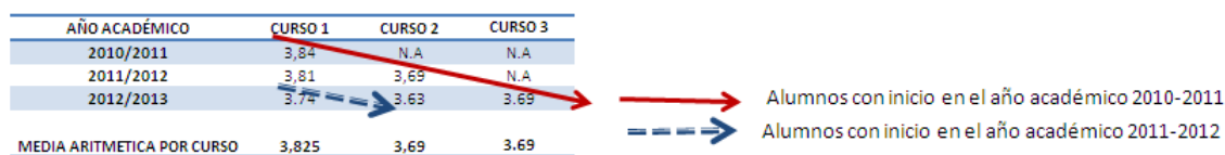
Figura 1: Análisis longitudinal de la valoración del título.

Aunque conscientes de que habría que esperar al curso académico siguiente (2013-2014) para tener una visión longitudinal de los graduados respecto de la valoración global del título, la tendencia muestra una valoración mínima de 3.69 sobre 5.