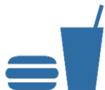
Espacios destinados al consumo de alimentos